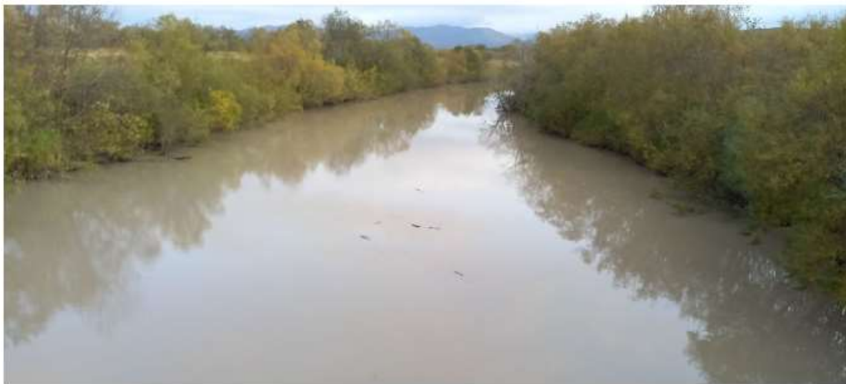
Фото реки Углегорки из группы " Углегорский форум "

Жители Углегорска, которым не привыкать к проблемам с водой (то ее нет, то она грязная и мутная), комментируют ситуацию под постом в телеграм-канале " Углегорские вести ". Многие жалуются на то, что качество воды, когда она течет из-под крана, отвратительное. "Это не река, а болото с грязью", "Стакан воды негде взять. Про помыться уже молчу. Вода вся в пене" — вот некоторые комментарии.