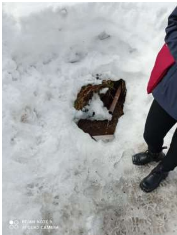
Фото4.Родник рядом со стадионом «Бумажный»