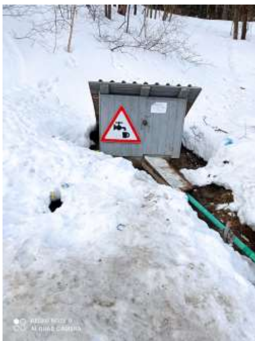
Фото3. Родник на улице Долинской 2.