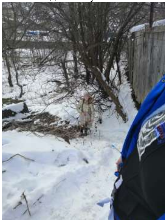
Фото 6. Родник за стадионом СОШ№1