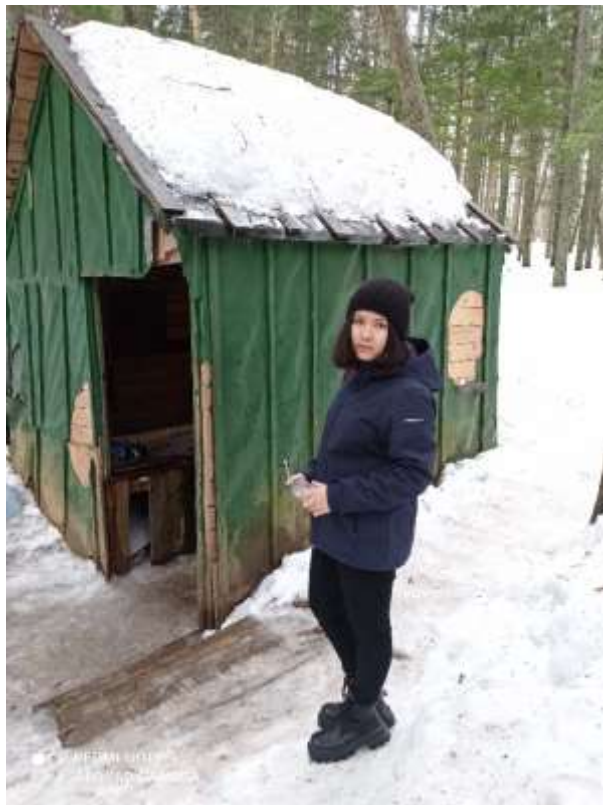
Фото2. Родник на ул. Долинская (колодец)